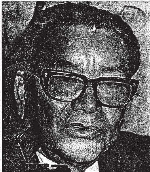
Miguel Angel Rivera Portillo, presidente de la Corte Suprema de Justicia.